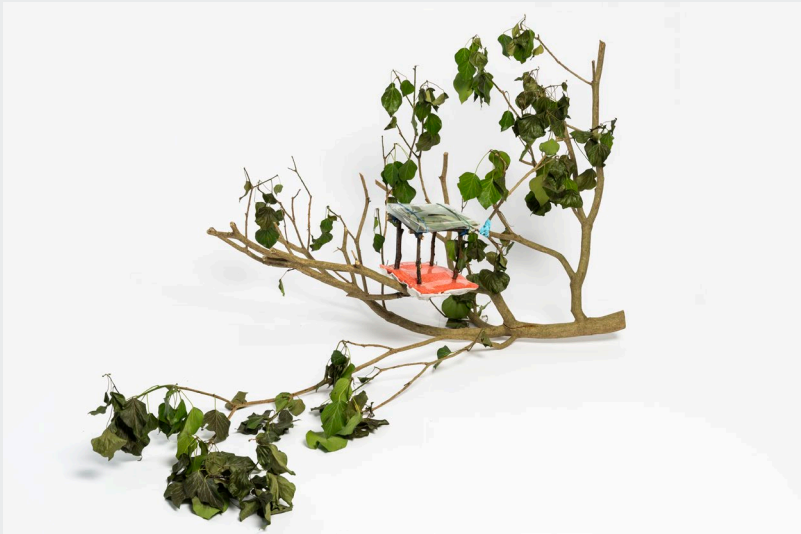
We commit to making art, we commit to create II, 2024 - Baumhaus, Foto: Otto Saxinger