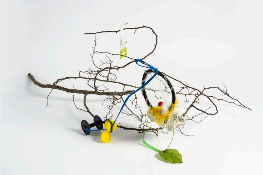
We commit to making art, we commit to create II, 2024 - Baumhaus