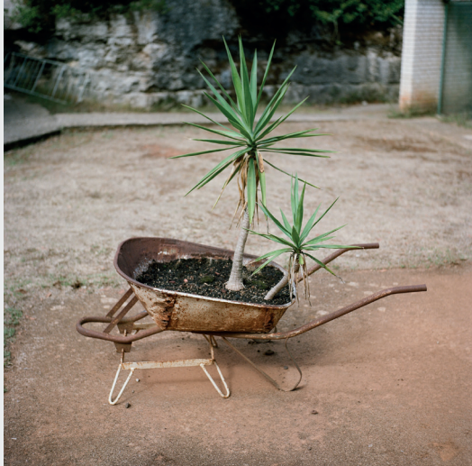
Moritz Matschke, Verzweigte Assistenzen, bis 22. Mai 2026 im Schauraum des KunstRaum Goethestrasse xtd